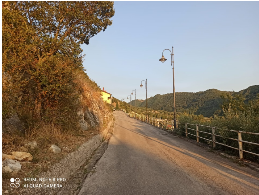
Via Santa Lucia