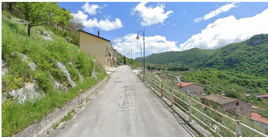
Via Padre Pio